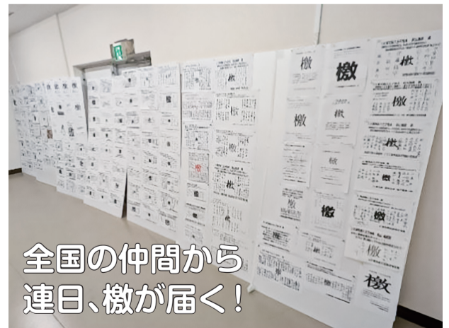
全国の仲間から連日、檄が届く！

東労組に入らなければ泣き寝入りせざるを得なかったのではないのでしょうか。また、他労組は社員Aに対し「身から出た錆」と述